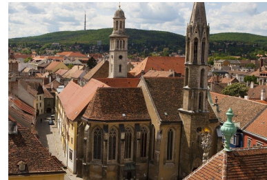
Sopron/Ödenburg: Vorne Geißkirche; (dahinter links) Turm der Evangelischen Kirche

Sopron/Ödenburg: Stadtrundgang mit Führung(en) Evang. Kirche (1782/83), drittgrößte evang. Kirche in Ungarn (Eine evang. Gemeinde ist seit 1565 nachweisbar); Kathol. „Geißkirche“ (1280 Klosterkirche), zeitweise auch politisches Zentrum Ungarns. Beim Stadtrundgang besichtigen wir weiters den Hof des für evangelische Gottesdienste genutzten Eggenberg-Hauses.